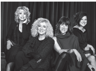
MARTINE ST-CLAIR, MARIE MICHÈLE DESROSIERS, LUCE DUFAULT, MARIE-ÉLAINE THIBERT