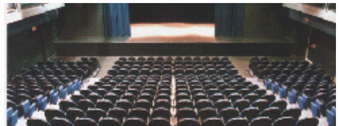
SALLE JEAN-LOUIS-MILLETTE, ITALIENNE