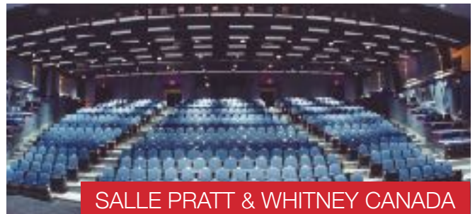
SALLE PRATT & WHITNEY CANADA