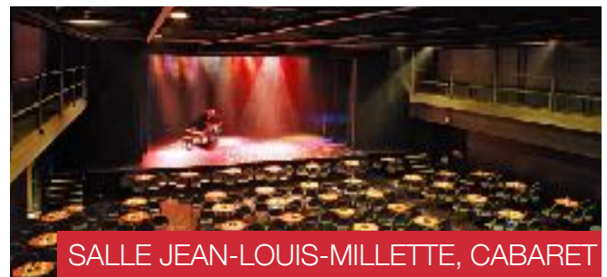
SALLE JEAN-LOUIS-MILLETTE, CABARET