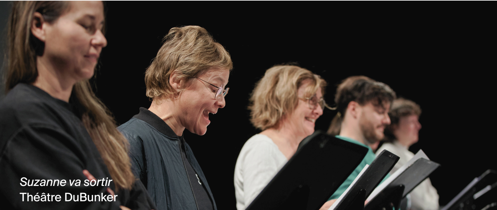
Suzanne va sortir Théâtre DuBunker

Le Théâtre de la Ville est heureux d'annoncer la 30 e édition des Fenêtres, regard sur le théâtre en création qui aura lieu du 16 au 18 novembre 2026. Cet événement a pour mission de mettre en lumière des projets en théâtre de création à différents stades de production et de favoriser la circulation des œuvres sur le territoire.