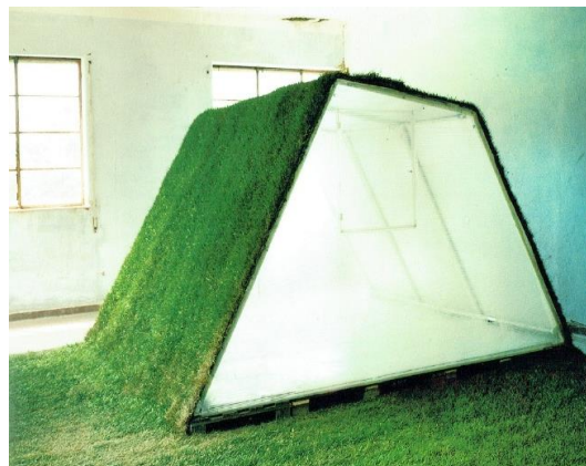
Maison de Plume