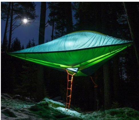
Maison de Taciturne