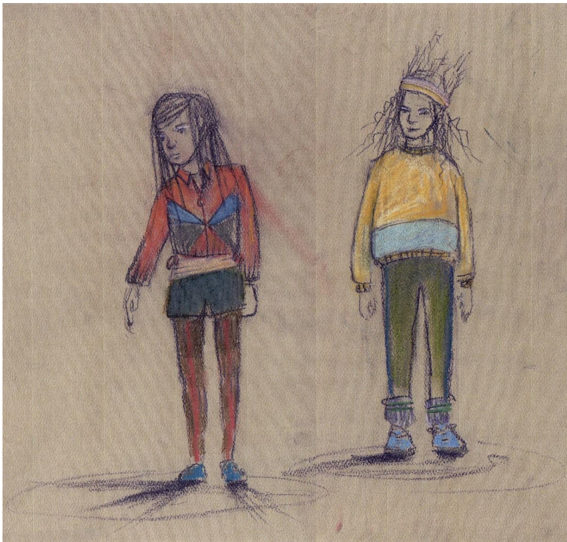
Croquis des costumes par Cynthia Saint-Gelais

Pour les plus vieux, l'éducateur peut tenter d'expliquer le mouvement de la terre, de la lune et du soleil. Avec une ampoule pour le soleil, la tête d'un enfant pour la terre et un ballon pour la lune (un ballon que l'enfant tient dans ses mains).