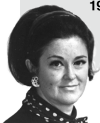
Marie-Claire Kirkland-Casgrain Première femme élue députée au Québec

La liste complète : www.assnat.qc.ca/fr/patrimoine/femmes.html