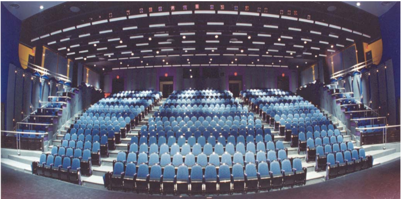
Note : photo à titre indicatif seulement (voir plan).

Disponible sur notre site Internet www.theatredelaville.qc.ca ou en téléphonant au directeur technique.